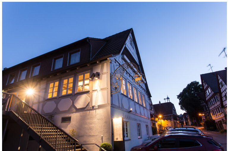
Hotel + Restaurant Lamm Rosswag

Am Abend findet in Rosswag ein Weinfest statt. Wir kehren Abends auf dem Fest ein. Deshalb findet an diesem Abend kein festes Abendessen statt.