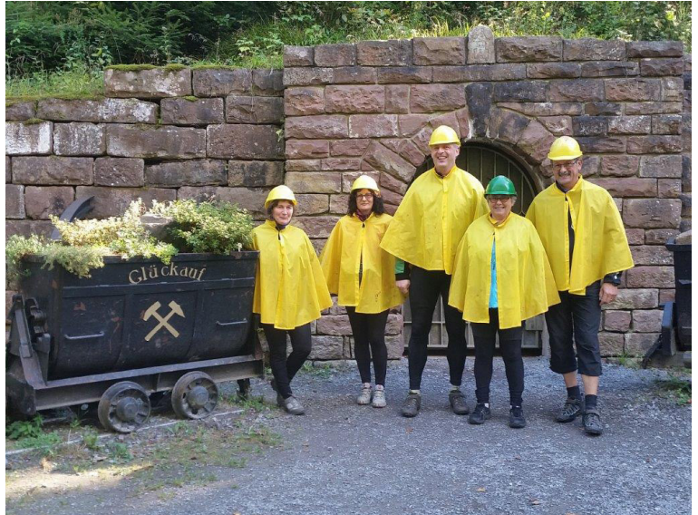
Vor dem Bergwerk

Abendessen reserviert im Hotel nach "kleiner Karte" (nicht incl.) oder nach vorheriger Abmeldung im Ort.